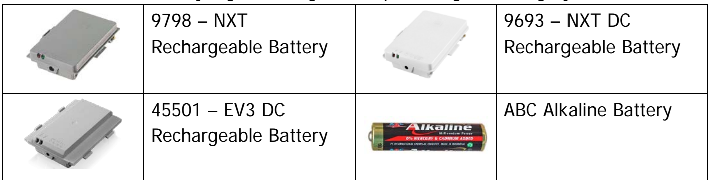
Tabel 2. Baterai yang boleh digunakan pada Regular Category IRO2018

11. Baterai robot harus bermerek LEGO® atau merek lain yang ditunjuk panitia, seperti ditunjukkan pada tabel 2. Robot yang menggunakan tipe baterai/sumber tenaga lain akan didiskualifikasi pada pertandingan tersebut.