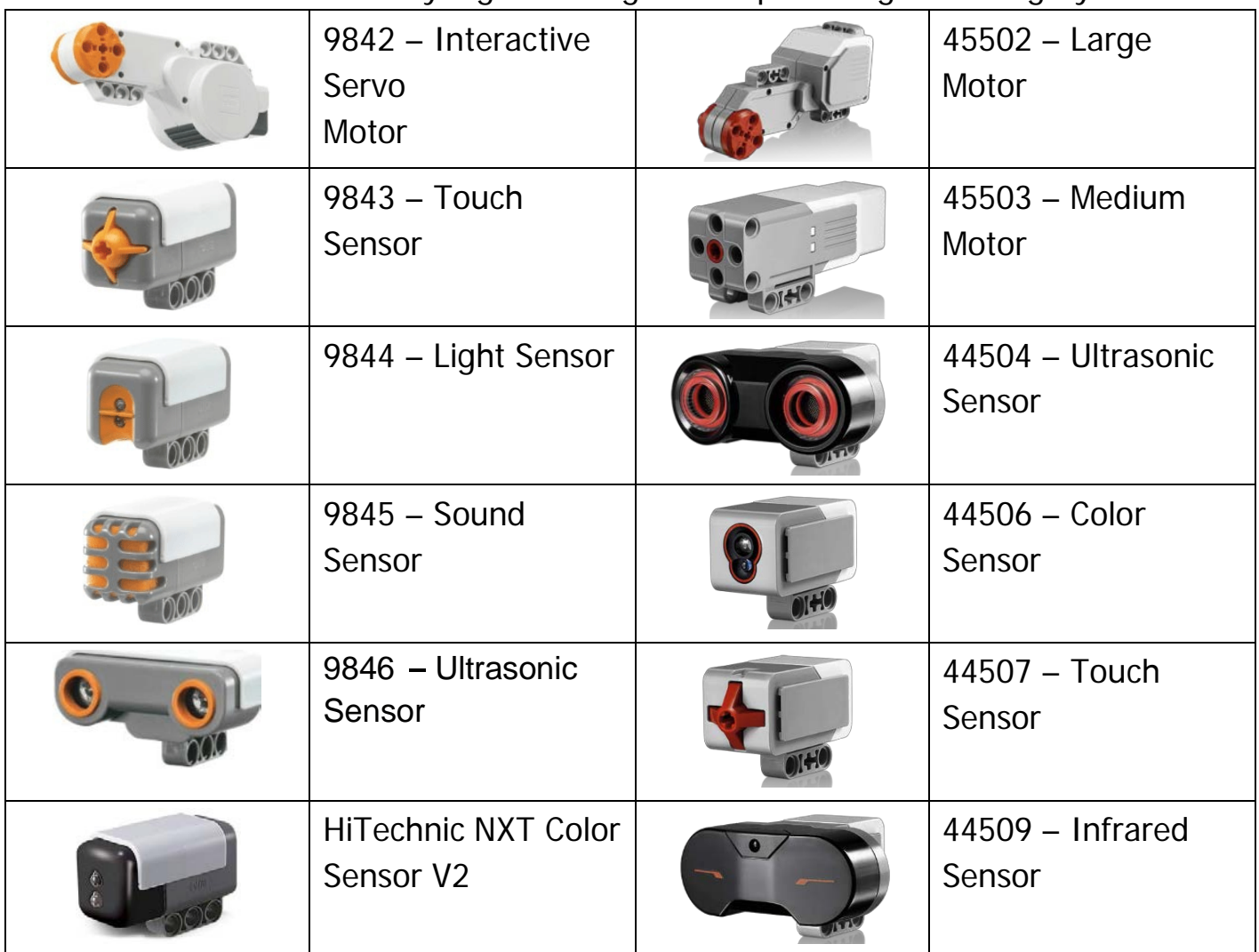
Tabel 1. Motor dan sensor yang boleh digunakan pada Regular Category IRO2019

11. Motor dan sensor untuk robot harus bermerek LEGO® dan HiTechnic. Produk dengan merek lain tidak diperbolehkan. Tim tidak boleh memodifikasi bagian apapun (contohnya: NXT, EV3, motor, dan sensor, dan lain-lain). Robot yang dibuat dengan bahan hasil modifikasi akan didiskualifikasi pada pertandingan. Lihat daftar sensor dan motor yang diijinkan pada tabel dibawah.