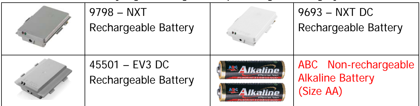
Tabel 2. Baterai yang boleh digunakan pada Regular Category IRO2017

11. Baterai robot harus bermerek LEGO® atau merek lain yang ditunjuk panitia, seperti ditunjukkan pada tabel 2. Robot yang menggunakan tipe baterai/sumber tenaga lain akan didiskualifikasi pada pertandingan tersebut.